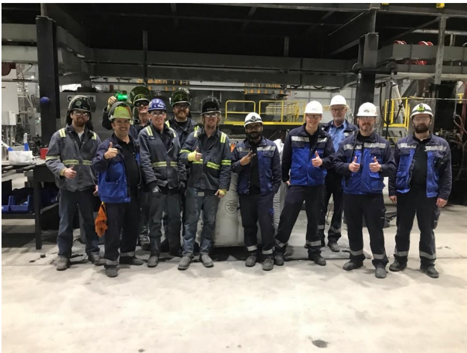
Das Inbetriebnahme-Team nach erfolgreichem Start der zweiten Phase.

Die Mund-Nasen-Schutzmasken wurden nur während der Fotoaufnahmen abgenommen.