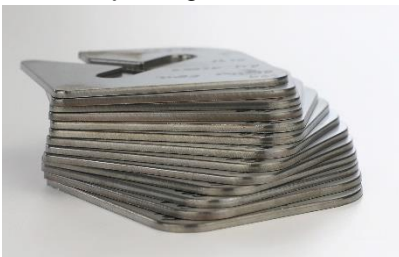
Bild 1: Metallisch blanke Schnittflächen dank der HiFinox-Technologie für das Plasmaschneiden von Edelstahl und Aluminium