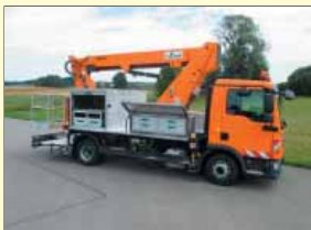
11488 - GSR E180TJ 18m - MAN TGL - Bj. 2015