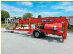
12855 - DENKA DL30 30m - Batterie & Diesel - Bj. 18