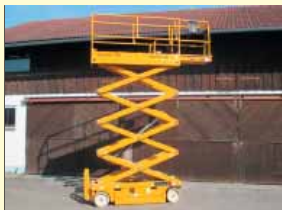
18809 - Haulotte Compact10N 10m - Batterie - diverse Bj.