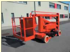
3104 - PB Dino 1120 11,2m - Batterie - Bj. 2000