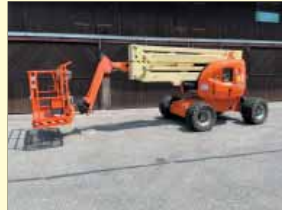
20660 - JLG 450 AJ 15,7m - Allrad-Diesel - Bj. 08