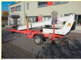
21320 - Dino Lift 180T 18m - 230V - Bj. 2007