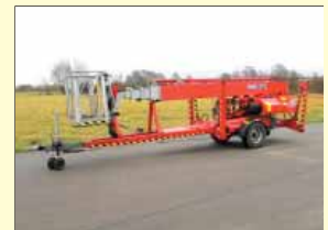
18565 - DENKA DL25 25m - Batterie & Diesel - Bj. 06

Langzeit-Miete und Finanzierung möglich. Fest kalkulierbare Werte ohne Risiko Zwischenverkauf vorbehalten