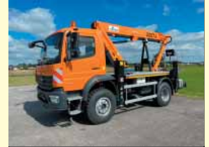
19330 - GSR B220TJ 22m - MB Atego 4x4 - Bj. 21