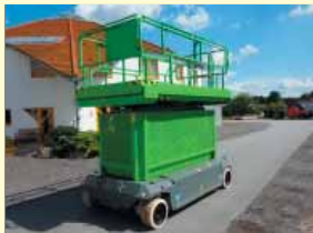
7811 - PB S171-16E 17,10m - Batterie - Bj. 2007