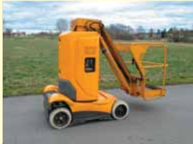
19846 - Haulotte Star10 10m - Batterie - diverse Bj.