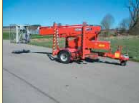
1065 - DENKA DK7 MK21 21m - Hybrid - Bj. 2002