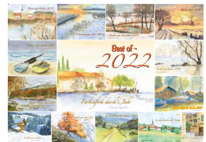
Aquarelle von Elisabeth Rothlehner

Zum Jahresende wünschen wir Ihnen, Ihren Familien und Ihren Mitarbeitern einen guten Jahresendspurt, Frohe Weihnachten und viel Glück, Gesundheit und Erfolg im Neuen Jahr 2022.