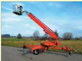
1482 - DENKA DK3 MK25 25m - Batterie - Bj. 1995