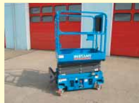
20470 - Instant IX1330 6m - Push Around - Bj. 2021