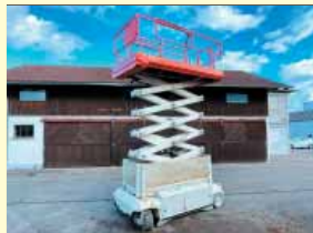
10614 - PB S151-16 E 15m - Batterie - Bj. 2014