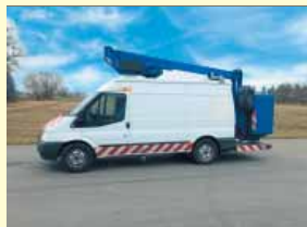
17954 - GSR E140TJV 13,5m - Ford Transit - Bj. 2013