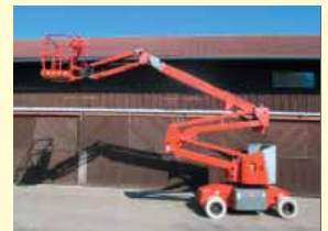
18932 - Haulotte HA15IP 15m - Batterie - diverse Bj.