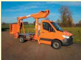
19036 - GSR E140TJV 13,6m - MB 314 - Bj. 2021