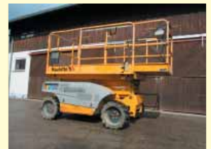
20420 - Compact 10DX 10,3m - Allrad Diesel - Bj. 08