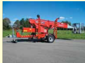
20030 - DENKA DK18 18m - Batterie - Bj. 2021