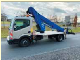
12615 - GSR B230T 22,5m - Nissan Cabstar - Bj. 13