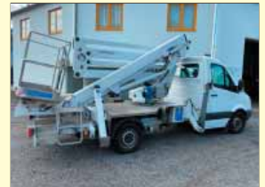
20170 - CTE Z 20 19,8m - MB 311 CDI - Bj. 2007