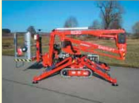
20816 - Easylift R130 12,2m - 230V & Benzin - Bj. 21

Bei Interesse bitte Geräte markieren und mit dem „Versenden“ Button auf Seite 2 an uns zurückschicken