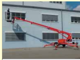
20964 - Europelift TM13T 13m - 230V & Benzin - Bj. 21