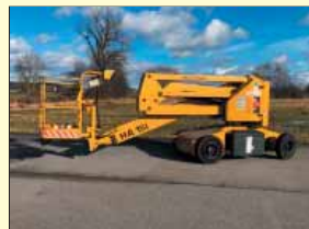
18402 - Haulotte HA 15 I 15m - Batterie - Bj. 1999