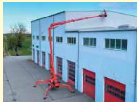
20747 - Easylift RA 31 31m - 230V & Diesel - Bj. 21