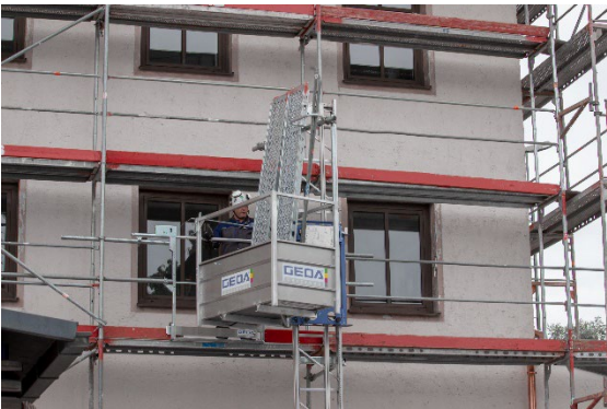
GEDA 200 Z