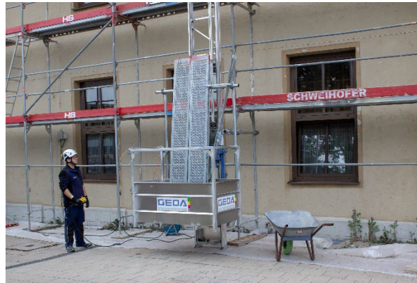
GEDA 200 Z