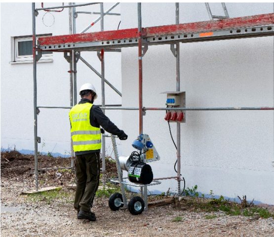
GEDA Maxi 150 S