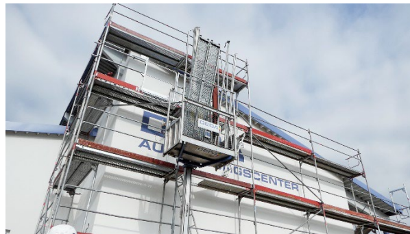
GEDA 300 Z