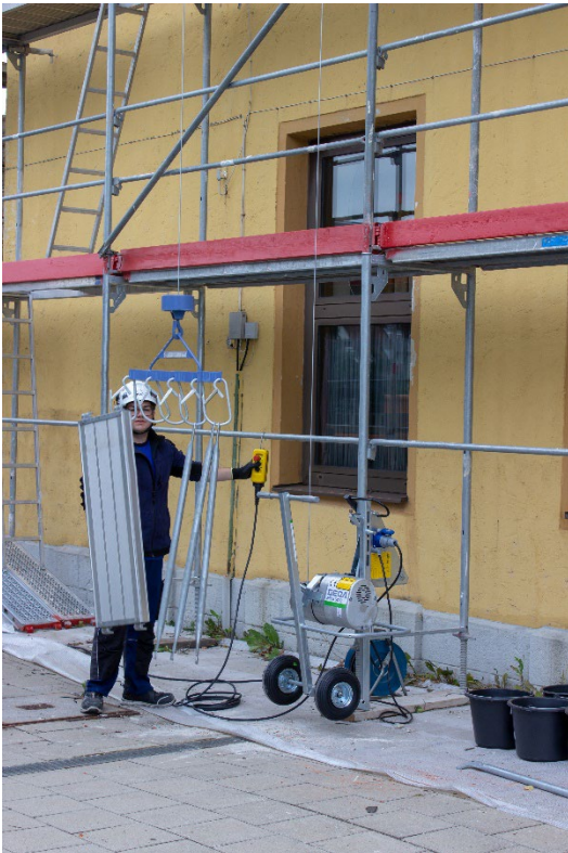
GEDA Maxi 120 S / 150 S